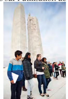
Les étudiants au Monument commémoratif du Canada à Vimy (Stuart Foster)