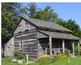
Reconstruction de la propriété familiale Donnelly à Lucan, Ontario (Jennifer Pettit)