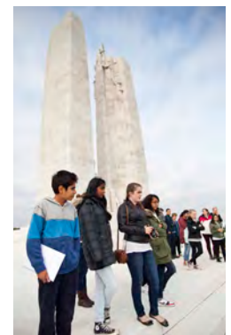
Students at Canadian War Memorial, Vimy Ridge