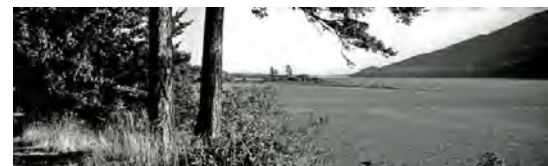
Portage Island, Lummi Reservation