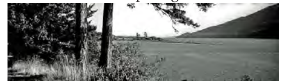
Portage Island, Lummi Reservation