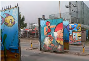
Des barrières dans un Mur de la paix pendant Les Troubles en Irlande du Nord.