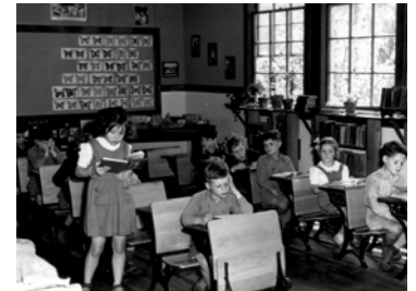
ONF Canada, n.d. 2-32062. Droit d'auteur expiré (Penney Clark)