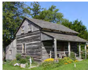
Reconstruction of Donnelly homestead, Lucan, Ontario