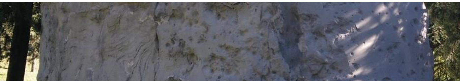
Detalle de los restos de metralla en el monumento al Dr. Federico Rubio y Galí, Parque del Oeste, batalla de Ciudad Universitaria (noviembre de 1936), Madrid